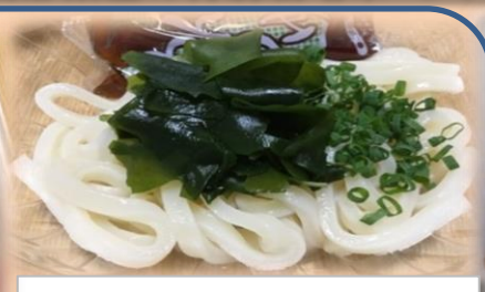
ミニうどん、そば 250円 (無くなり次第終了)