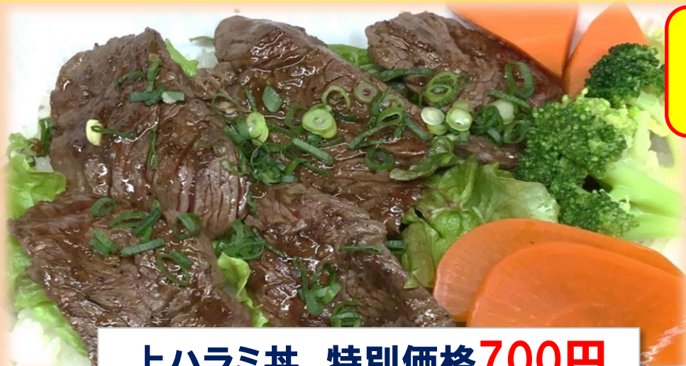
上ハラミ丼 特別価格700円