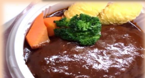
ハンバーグ弁当600円