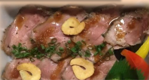
ローストビーフ丼600円